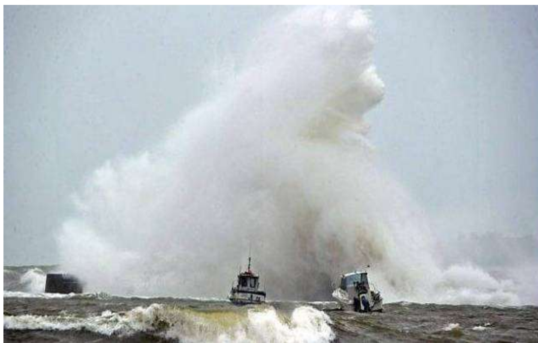
Vlny u městečka Loener v Bretani